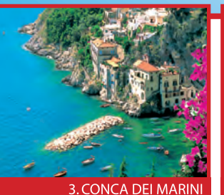
3. CONCA DEI MARINI