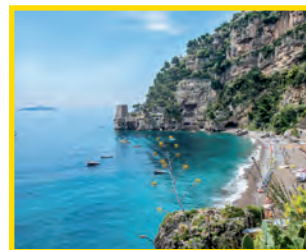
2. SPIAGGIA DEL FORNILLO