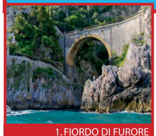
1. FIORDO DI FURORE

Published by cart&guide per You Know! © Carr&guide