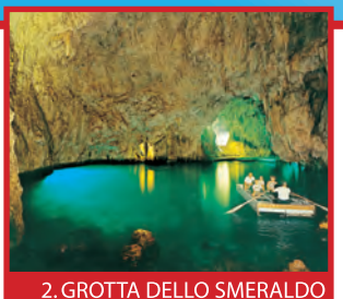
2. GROTTA DELLO SMERALDO