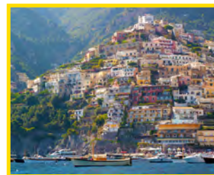
4. RIONE FORNILLO