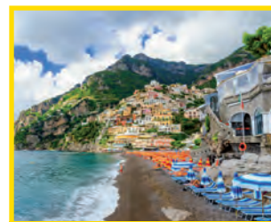
5. SPIAGGIA GRANDE