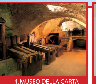
4. MUSEO DELLA CARTA