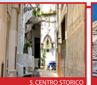
5. CENTRO STORICO