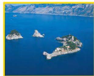
1. LI GALLI