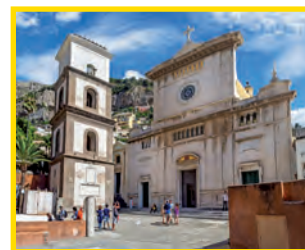
6. CHIESA DELL'ASSUNTA